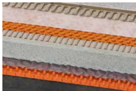
Schlüter-TROBA-PLUS 8 (12)

Na construção em cama de gravilha ou saibro < 5 cm pode ocorrer um ligeiro efeito de mola. Para evitar este efeito, recomendamos a colocação sobre Schlüter-TROBA, ver ficha de dados do produto 7.1.