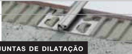
PERFIL DE JUNTAS DE DILATAÇÃO

PARA ÁREAS SUJEITAS A FORTES SOLICITAÇÕES