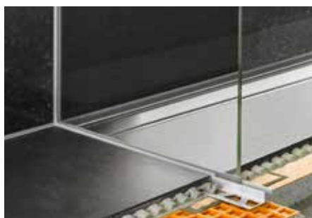
Montagem na área do chuveiro com um elemento de vidro