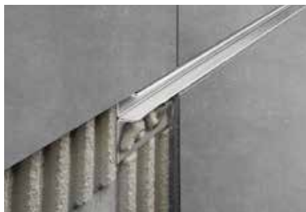
Instalação como sanca na área da parede