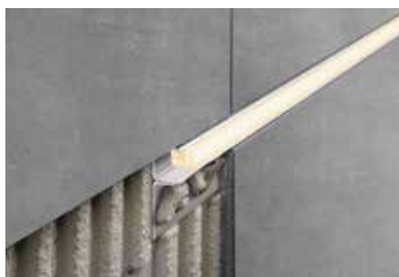
Instalação como iluminação decorativa com Módulo LED LIPROTEC-LLPM

tar toda a superfície do perfil na camada de contacto da cerâmica, de modo a impossibilitar a acumulação de água nas cavidades.