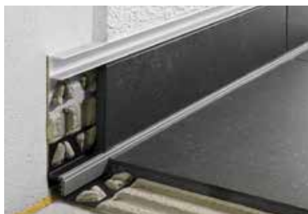
Montagem na área do rodapé