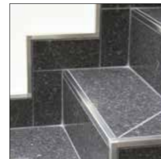
Arestas de escadas e remates da base

A versão em aço inoxidável também pode ser utilizada como remate para pavimento ou como aresta para escadas. Da mesma forma, é possível obter remates, cantos ou remates de solo junto a outros materiais, como alcatifas e parquet.