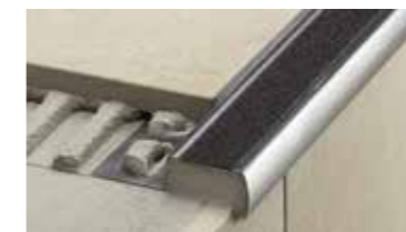
Schlüter®-TREP Perfis antiderrapantes para escadas