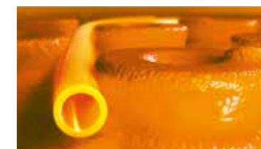
Schlüter®-BEKOTEC-THERM O pavimento de cerâmica climatizado