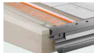
Sistemas para varandas Schlüter® Solução completa para construções novas e recuperação de varandas e terraços