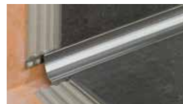
Schlüter®-DILEX Sistema de perfis para juntas de dilatação e de bordo duradouras e isentas de manutenção

Deseja obter mais informações sobre outros produtos e soluções da Schlüter para a colocação de cerâmica? Poderá obter os seguintes folhetos junto dos nossos representantes. Para mais informações visite a nossa página www.schluter.pt .